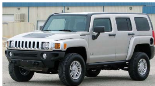
HUMVEE W WERSJI WOJSKOWEJ I CYWILNY HUMMER H3

W 1979 roku armia amerykańska uznała, że już czas zastąpić wystuzonego, produkowanego od lat pięćdziesiątych Forda M141 MUTT (następcę legendarnego Willysa z okresu drugiej wojny światowej) nowym, uniwersalnym pojazdem terenowym. Specyfikacja wymagała dobrych osiągnięć zarówno na drodze, jak i w terenie, zdolności do przewożenia dużego ładunku i lepszej przeżywalności załogi. Pojazd nazwano HMMWV ( high-mobility multipurpose wheeled vehicle – wielo-