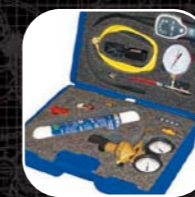
Zestaw do badania uszczelnienia azot/wodór (hydrogen) - 007950025880