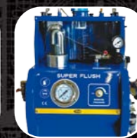
Super Flush - urządzenie do płukania układów klimatyzacji pneumatyczne z pulsacją (bez zestawu adapterów w komplecie) - 007936210770