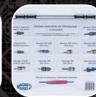
Zestaw zaworków do klimatyzacji z kluczem - 007936210050