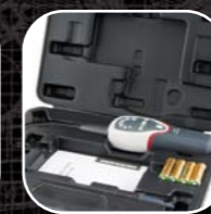
Elektryczny wykrywacz uszczelnienia czynniki HFC, R134A, R1234yf, Hydrogen - 007950027000