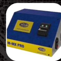
Ozonator M-MX PRO - 007936211355