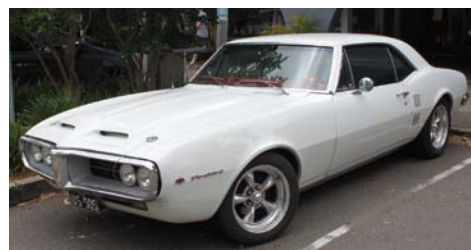
Pontiac Firebird z 1967 roku