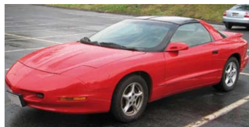
Ostatnia generacja modelu Trans Am z lat 1993-2002

Pokazany na dużym ekranie w 1977 roku film „Mistrz kierownicy ucieka” ( Smokey and the Bandit ) okazał się po „Gwiezdnych wojnach” drugą najbardziej dochodową produkcją roku i w samej tylko Ameryce Północnej przyniósł zysk ponad 126 milionów dolarów brutto przy budżecie zaledwie 4,3 miliona. Główne role zagrali w nim: Burt Reynolds i Pontiac Firebird Trans Am. Gdy reżyser Hal Needham przekonał General Motors do wykorzystania w filmie ich pojazdu, wybór padł na markę Pontiac i mocny, sportowy samochód Trans Am.