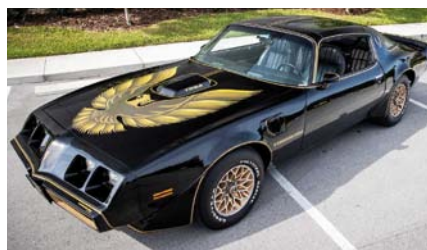
The Bandit – bohater filmu „Mistrz kierownicy ucieka”