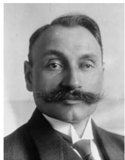
Pierre Louis Delage (1874-1947)