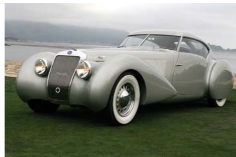
Futurystyczny delage d8-120s aero-coupé z 1937 roku

Delage w zamyśle konstruktorów miał być tak luksusowy, jak Rolls-Royce, szybki jak Duesenberg i elegancki jak Hispano-Suiza. I rzeczywiście – w latach międzywojennych XX wieku należał do ścisłej czołówki światowej motoryzacji.