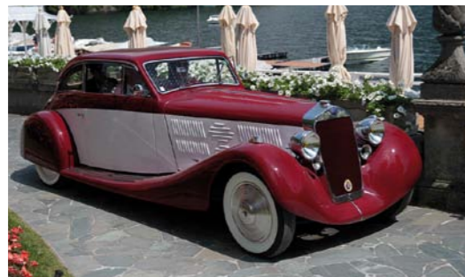
Delage D8-105 sport aerodynamic coupé z lat 1934-35