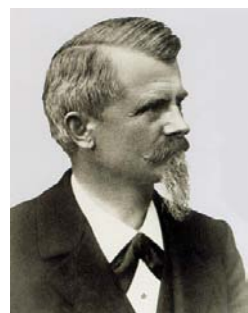
Wilhelm Maybach (1846-1929)