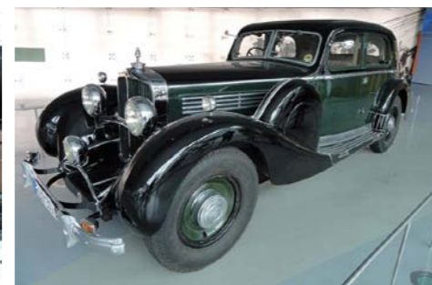
Maybach DS8 Zeppelin

Wielu mniej gorliwych miłośników motoryzacji z nazwą Maybach zetknęło się po raz pierwszy dopiero niedawno, gdy Mercedes wskrzesił dawną markę, wypuszczając na rynek superluksusową limuzynę dla bardzo zamożnych nabywców.