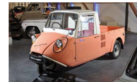
ROK 1949 – MAZDA ROZPOCZYNA EKSPORT TRÓJKOŁOWYCH CIĘŻARÓWEK DO INDII