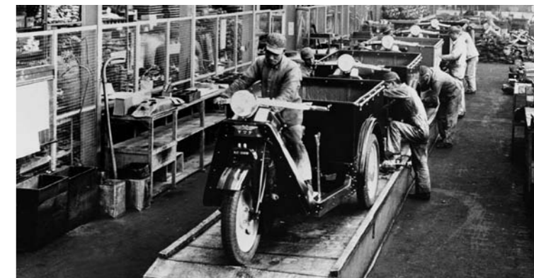
PRODUKCJA PIERWSZYCH POJAZDÓW RUSZYŁA W 1931 ROKU. BYŁY TO MAŁE, TRÓJKOŁOWE FURGONY „MAZDA-GO”

strukcję. W latach siedemdziesiątych, po wyeliminowaniu głównych wad związanych z uszczelnieniem komory spalania i nadmiernym zużyciem oleju, połowa produkcji samochodów Mazda napędzana była silnikiem Wankla.