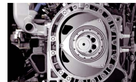
ROK 1963 – NA TOKYO MOTOR SHOW POJAWIA SIĘ PIERWSZY SILNIK ROTACYJNY