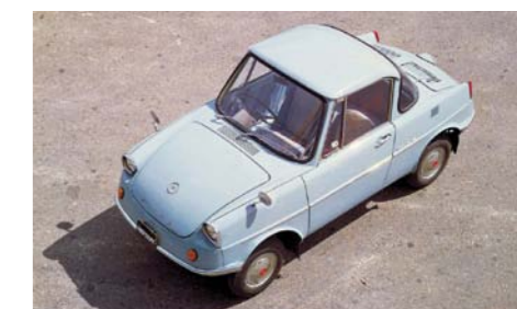
ROK 1960 – MAZDA POSZERZA PRODUKCJĘ O INNE SEGMENTY. M.IN. PIERWSZY SERYJNIE PRODUKOWANY MODEL COUPÉ: MAZDĘ R360