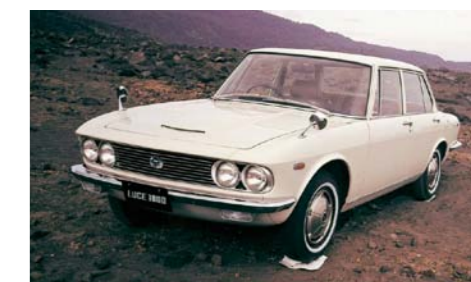
MAZDA LUCE Z NADWOZIEM ZAPROJEKTOWANYM PRZEZ WŁOSKĄ FIRMĘ BERTONE