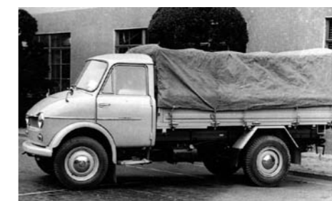
POD KONIEC LAT PIĘĆDZIESIĄTYCH PROGRAM POJAZDÓW UŻYTKOWYCH OBEJMUJE OKOŁO 30 MODELI, W TYM MAZDĘ ROMPER