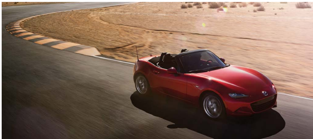
MAZDA MX-5 – KLASYCZNY ROADSTER Z SILNIKIEM ROTACYJNYM I NAPĘDEM NA TYLNE KOŁA – JEST WG KSIĘGI REKORDÓW GUINNESSA NAJLEPIEJ SPRZEDAJĄCYM SIĘ DWUMIEJSCOWYM SPORTOWYM KABRIOLETEM NA ŚWIECIE