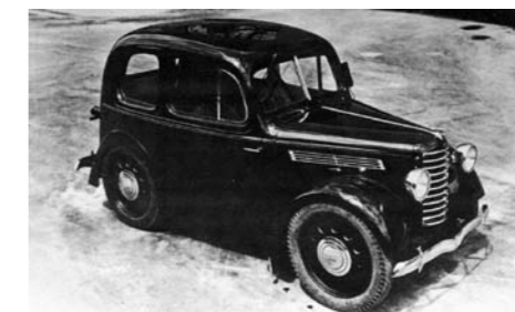
ROK 1936 – POWSTAJE PIERWSZY PROTYP RODZINNEGO SAMOCHODU OSOBOWEGO

Łączna produkcja modelu w kilku nastu wersjach wyniosła 900 000. ■