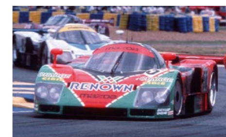
SILNIK ROTACYJNY ZAPEWNIŁ MARCE ZWYCIĘSTWO W 24-GODZINNYM WYŚCIGU LE MANS I TRAFIŁ POD MASKĘ EKSKLUZYWNEJ, SPORTOWEJ MAZDY COSMO SPORT