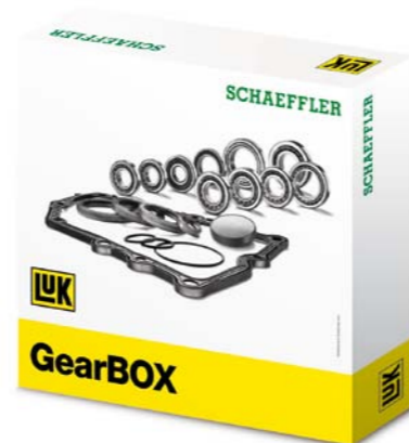
ZESTAW NAPRAWCZY DO SKRZYŃ BIEGÓW LUK GEARBOX

Ponieważ rozwiązania techniczne stosowane przez producentów pojazdów stają się coraz bardziej skomplikowane, ich naprawa wymaga kompleksowego podejścia. Wychodząc naprzeciw oczekiwaniom rynku, Schaeffler oferuje coraz większą ilość zestawów naprawczych. Dużą popularnością cieszy się np. zestaw naprawczy do skrzyń biegów LuK GearBOX, zapewniający wszystkie niezbędne części przy naprawie najpopularniejszych skrzyń biegów i skracający czas naprawy. Podobnie rzecz się ma z zestawami na-