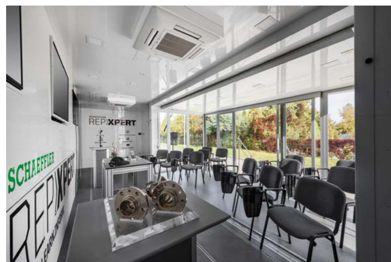
WNĘTRZE MOBILNEGO CENTRUM SZKOLEŃ ZAPEWNIĄ KOMFORTOWE WARUNKI DO PROFESJONALNYCH SPOTKAŃ W DOWOLNYCH ZAKĄTKACH KRAJU