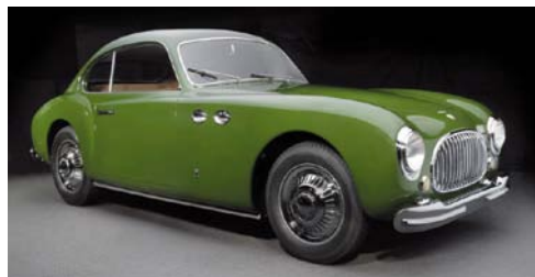
Cisitalia 202 – berlinetta z 1947 roku