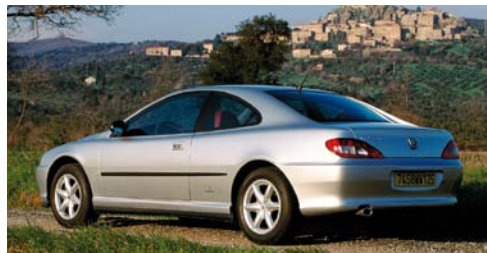
Peugeot 406 coupé (1997)

Do Battisty Fariny, urodzonego w 1893 roku jako dziesiątego z jedenastu braci, od najmłodszych lat przylgnęło przezwisko Pinin , co w piemonckim dialekcie oznacza: najmłodszy i najmniejszy. Jakoż i wzrost miał nieduży (152 cm), lecz wielkie ambicje. W pracy, którą jako nastolatek wykonywał w należącym do brata warsztacie blacharskim, rozwinął umiejętności projektowania i konstrukcji samochodowych nadwozi. Dla rozszerzenia horyzontów odwiedził zakłady Forda w Detroit, gdzie podpatrzył kilka interesujących rozwiązań, ale bez wahania odrzucił intratną ofertę zatrudnienia. Miał inne plany. W wieku trzydziestu kilku lat założył własną firmę pod szyldem Carrozzeria Pinin Farina . Otwarty umysł, wyobraźnia, wrodzone zdolności projektowe i umiejętności menadżerskie spowodowały, że szybko zdobył uznanie. Nawiązał relacje z Alfą Romeo, Fiatem, Lancią, Nashem, Peugeotem, Rolls Roycem, Volvo i innymi, dla których projektował nadwozia.