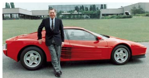
Sergio Pininfarina i jego legendarna Ferrari Testarossa (1984)