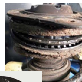
USZKODZONE MOCOWANIE GÓRNE

Górne zestawy montażowe występują w różnych wariantach: z łożyskiem zintegrowanym lub z łożyskiem jako osobnym elementem. Zestaw montażowy amortyzatora zapewnia połączenie całej kolumny z pojazdem, a tłumiąc drgania i wibracje – zapobiega przenoszeniu ich na nadwozie. Jest elementem bardzo mocno obciążonym, gdyż przenosi duże siły wzdłużne i poprzeczne z układu zawieszenia i kolumny amortyzatora.