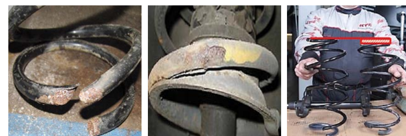
USZKODZENIA SPRĘŻYN ZAWIESZENIA

Symptomy te oznaczają konieczność wymiany sprężyn, które – podobnie jak amortyzatory – wymienia się parami.