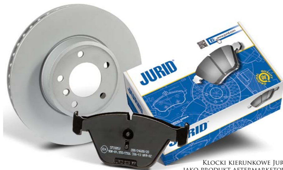
KLOCKI KIERUNKOWE JURID JAKO PRODUKT AFTERMARKETOWY

KLOCKI KIERUNKOWE TO ODPOWIEDŹ NA ROSNĄCE WYMAGANIA PRODUCENTÓW POJAZDÓW W ZAKRESIE REDUKCJI POZIOMU HAŁASU, WIBRACJI I UCIAŹLIWOŚCI W EKSPLOATACJI (NVH). ICH ZNACZENIE ROŚNIE WRAZ Z CORAZ WIĘKSZĄ POPULARNOŚCIĄ HYBRYD I SAMOCHODÓW ELEKTRYCZNYCH