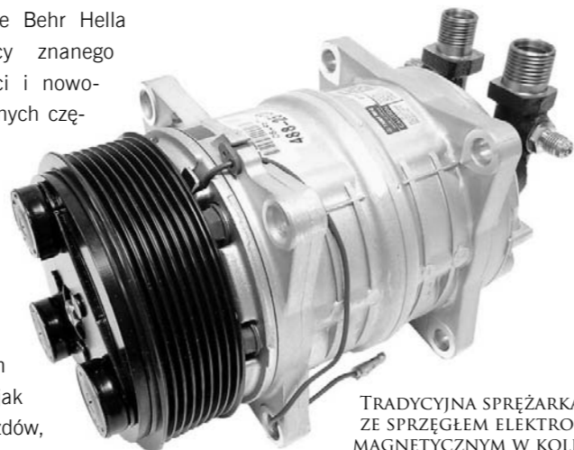
TRADYCYJNA SPRĘŻARKA ZE SPRĘGŁEM ELEKTROMAGNETYCZNYM W KOLE PASOWYM

W asortymencie Behr Hella Service, dostawcy znanego z wysokiej jakości i nowoczesności oferowanych części do samochodowych układów termicznych, znajduje się bogata gama sprężarek klimatyzacji. Mowa tu zarówno o typach konstrukcyjnych, jak i o rodzajach pojazdów, w których są wykorzystywane.