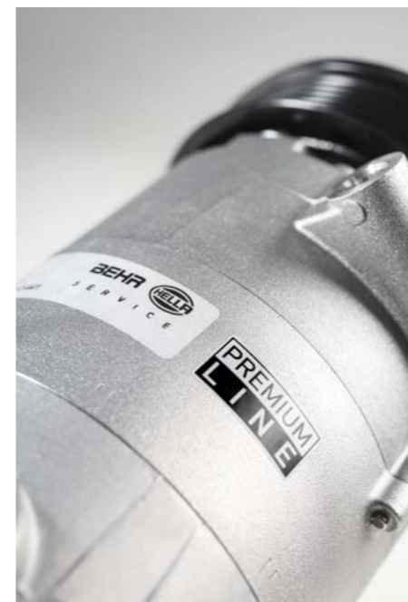
FIRMOWE OZNACZENIE ZAMIENNYCH SPRĘŻAREK KLASY PREMIUM

Oferta rynkowa sprężarek Behr Hella Service zawiera każdy z tych typów konstrukcyjnych, a aplikacje przeznaczone są dla niemal całej gamy obecnie eksploatowanych pojazdów osobowych. Ważną i liczną grupę stanowią też sprężarki przeznaczone dla samochodów ciężarowych.