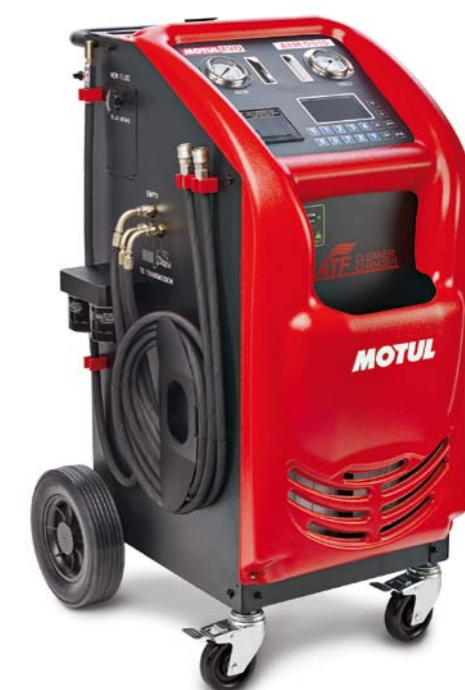
W SKŁAD PAKIETU MOTULEVO WCHODZI URZĄDZENIE SERWISOWE MOTUL ATM0915 PRZEZNACZONE DO DYNAMICZNEJ WYMIANY OLEJU

Dostęp do bazy danych dostępnych na stronie www.motulevo.com jest możliwy po zalogowaniu tylko dla partnerów projektu.