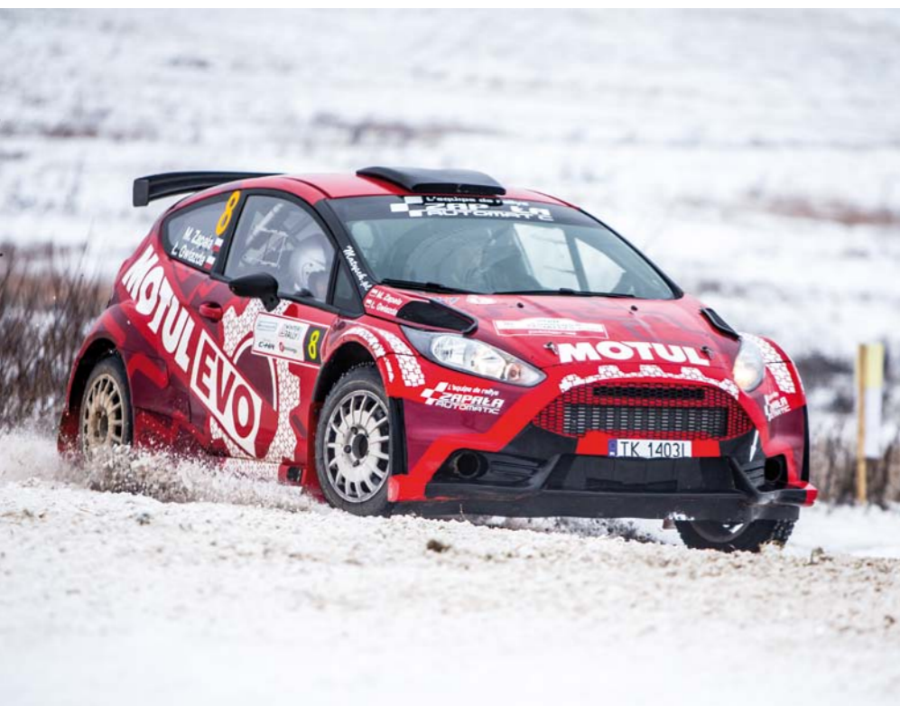
MOTULEVO JEST PIERWSZYM W EUROPIE KOMPLEKSOWYM PAKIETEM PRODUKTÓW DO OBSŁUGI AUTOMATYCZNYCH SKRZYNIĘ BIEGÓW

AUTOMATYCZNE SKRZYNIĘ BIEGÓW, TO SKOMPLIKOWANE UKŁADY MECHANICZNO-HYDRAULICZNO-ELEKTRYCZNE. WYMAGAJĄ OLEJÓW ODPOWIADAJĄCYCH ICH FUNKCJOM ORAZ ZAPEWNIĄCYCH WŁAŚCIWE TARCIE MIĘDZY ELEMENTAMI CIERNYMI HAMULCÓW