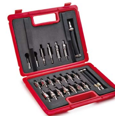
DO POŁĄCZENIA MASZYNY SERWISOWEJ ZE SKRZYNIĄ BIEGÓW W POJEŹDZIE SŁUŻY BOGATY ZESTAW ADAPTERÓW

Aby stać się partnerem MotulEVO trzeba skontaktować się ze swoim Dystrybutorem Autoryzowanym Produktów Motul lub bezpośrednio z przedstawicielem handlowym Motul w Polsce. Wszystkie dane znajdują się na stronie www.motul.pl oraz na www.motulevo.com .