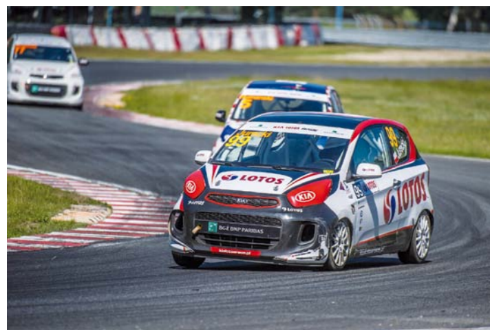
LOTOS OIL TESTUJE SWOJE PRODUKTY SMARNE TAKŻE W ZAWODACH SPORTOWYCH

udziałem rynkowym pojazdów wymagających oleju tej jakości. Zdaniem eksperta, ze względu na szeroką ofertę olejów silnikowych na rynku i dużą ilość specyfikacji jakościowych mogących generować problemy z zakupem przez użytkownika właściwego oleju na dolewkę, warto też oferować klientom, przy okazji wizyty, oleje w opakowaniach 1-litrowych, a warsztat traktować jako najbezpieczniejsze miejsce nie tylko na wymianę oleju, ale również na zakup oleju na dolewki.