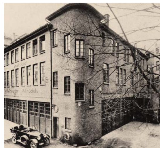
1921 R.: OD PIERWSZEGO SERWISU BOSCH W HAMBURGU FIRMA ROZPOCZĘŁA TWORZENIE SIĘCI OBSŁUGI KLIENTÓW

któremu firma osiągnęła nowy etap rozwoju. Już światowy prototyp okazał się jedynym w tamtych czasach niezawodnym produktem, który można było stosować w samochodach.