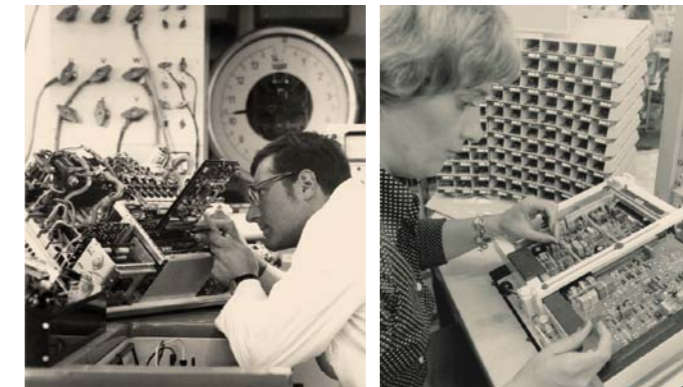
Z LEWEJ: 1970 R. – STANOWISKO POMIAROWE ELEKTRONIKI STERUJĄCEJ DO SAMOCHODU ELEKTRYCZNEGO