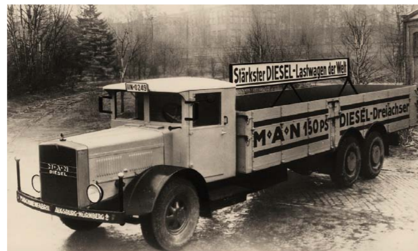
W 1927 ROKU MAN ZOSTAŁ PIERWSZYM ODBIORCĄ POMP WTRYSKOWYCH BOSCH. A W 1932 ROKU ZNALAZŁY SIĘ ONE W NAJMOCNIEJSZYM WÓWCZAS SAMOCHODZIE CIĘŻAROWYM