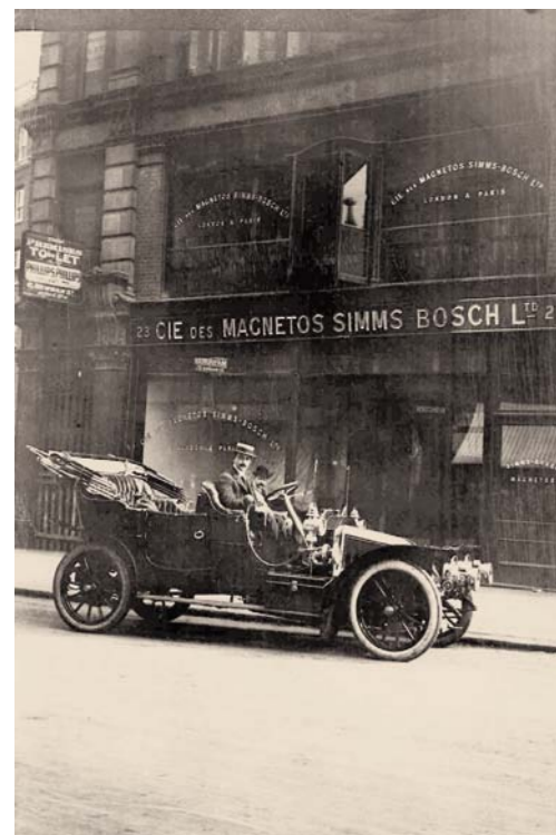
PIERWSZE PRZEDSTAWICIELSTWO ZAGRANICZNE – CIE DES MAGNETOS SIMMS-BOSCH LTD. W LONDYNIE