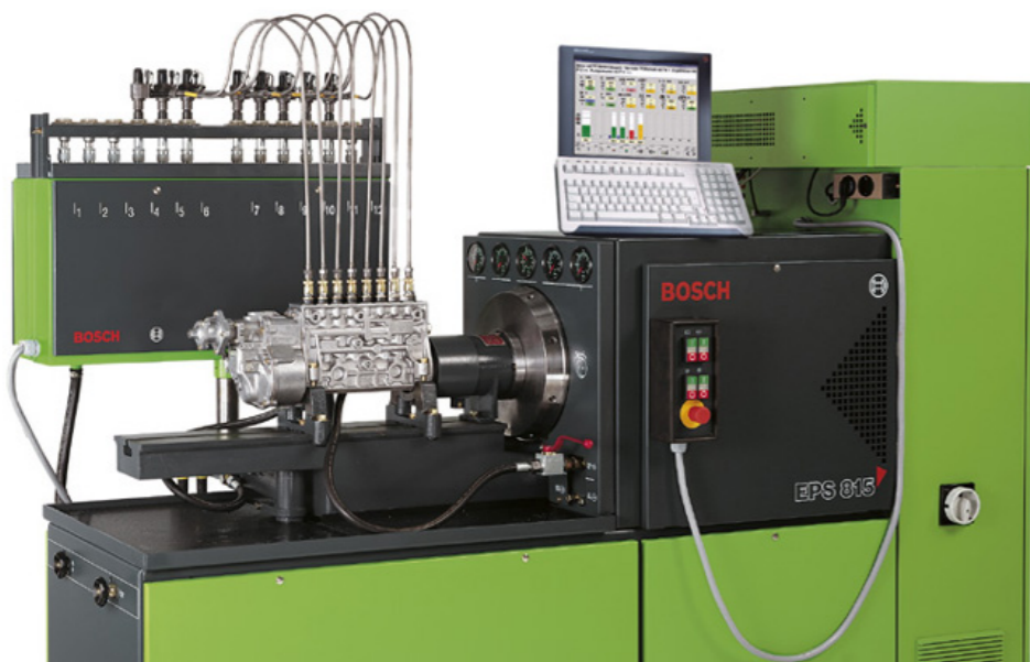
STÓŁ PROBIERCZY EPS 815 DO BADANIA POMP WTRYSKOWYCH