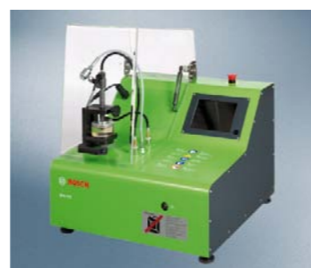
PRÓBNIK EPS 118 DO BADANIA WTRYSKIWACZY COMMON RAIL

Wszystkie te elementy wchodzą w zakres naszych dostaw. Na terenie całego kraju mamy sieć piętnastu serwisów urządzeń diagnostycznych. W praktyce działają one tak, że dystrybutor tego rodzaju produktów przekazuje nam informację poprzez portal internetowy o tym, że sprzedał urządzenie danemu klientowi. Wówczas serwis urządzeń diagnostycznych, który geograficznie położony jest najbliżej klienta, otrzymuje sms-em informację o nowym zleceniu. Pracownik serwisu ma obowiązek zadzwonić w ciągu 48 godzin do klienta i umówić się na wizytę. Wszystko rejestruje program obsługi zleceń. Zarówno dystrybutor, jak i pracownik Boscha wiedzą dokładnie, na jakim etapie realizacji jest zlecenie.