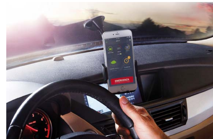
DANE Z INTERFEJSU PRZEKAZYWANE SĄ DO SMARTFONA KIEROWCY I RÓWNOCZEŚNIE DO NADZORUJĄCEGO POJAZD WARSZTATU ORAZ DO CENTRUM OPERACYJNEGO FIRMY TEXA

Podobne znaczenie dla pozyskiwania szerokich kręgów stałej klienteli ma jej informowanie z odpowiednim wyprzedzeniem o zbliżających się terminach przeglądów i okresowej obsługi połączone z wysłaniem stosownej oferty. Nawiązanie w ten sposób stałe kontakty pozwalają