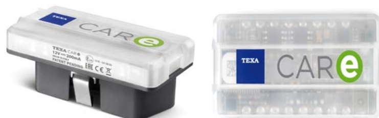
INTERFEJS TEXA CAR-E DO ZDALNEGO MONITORINGU POJAZDU

obecnymi w pojeździe oraz za pośrednictwem Bluetooth ze smartfonem kierowcy, używanym jako wyświetlacz i równocześnie telefon komórkowy, automatycznie łączący się z odpowiednim warszta-