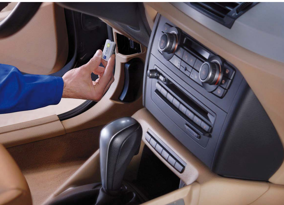
MINIATUROWY MODUŁ KOMUNIKACYJNY POBIERA I EMITUJE WSZYSTKIE DANE Z GNIAZDA OBD