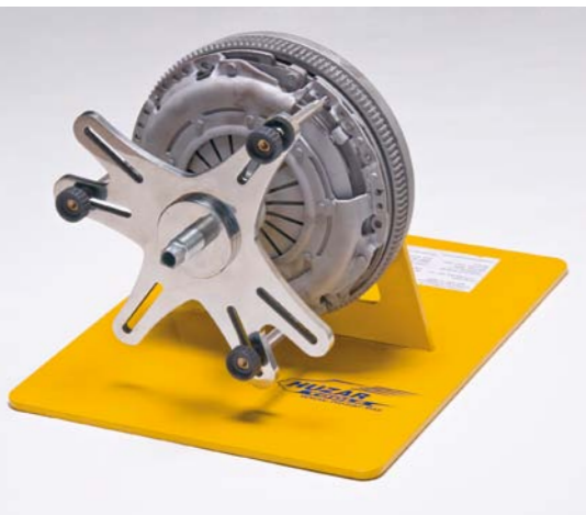
SPOSÓB ZAMOCOWANIA PRZYRZĄDU HUZAR DO SPRZĘGŁA SAMONASTAWNEGO