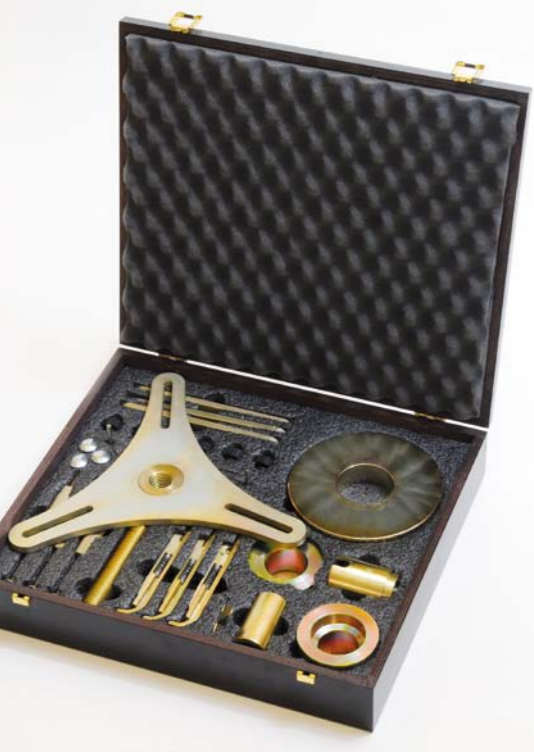
PRZYRZĄD MONTAŻOWY DRAGON WYKORZYSTUJE W SWEJ KONSTRUKCJI NIEKTÓRE FIRMOWE ROZWIĄZANIA ZASTOSOWANE JUŻ W HUZARZE