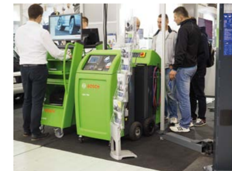
ROZLEGŁE EKSPOZYCJE WIELKICH PRODUCENTÓW DOSTARCZAŁY CAŁEJ GAMY TEMATÓW DO DYSKUSJI FIRMOWYCH EKSPERTÓW Z WARSZTATOWYMI PROFESJONALISTAMI