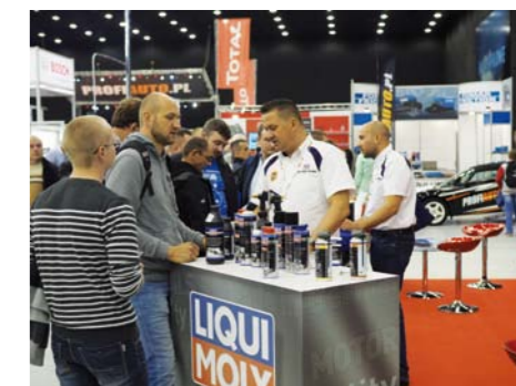
NAWET PRODUKTY POWSZECHNIE ZNANE POTRAFIĄ STAĆ SIĘ TARGOWĄ ATRAKCJĄ, JEŚLI MOŻNA O NICH DOWIEDZIEĆ SIĘ CZEGOŚ NOWEGO Z KOMPETENTNEGO ŹRÓDŁA