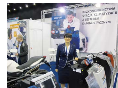
NIEKTÓRE NAJŚWIEŻSZE FIRMOWE NOWOŚCI WŁOSKICH PRODUCENTÓW MOŻNA BYŁO NIEMAL RÓWNOCZEŚNIE OBEJRZEĆ W KATOWICACH I W BOLONII