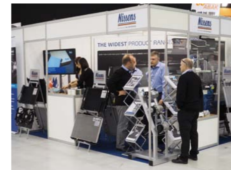
STANDARDOWE, TARGOWE STOISKA NAJLEPIEJ ODPOWIADAŁY FIRMOM STARAJĄCYM SIĘ NAWIĄZYWAĆ I PODTRZYMYWAĆ TYPOWO ROBOCZE KONTAKTY Z KLIENTAMI