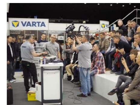
PRZY PRAKTYCZNYCH POKAZACH TECHNIK WARSZTATOWYCH PUBLICZNOŚĆ GROMADZI SIĘ NA STOISKACH TŁUMNIE, ŚWIETNYM WIĘC POMYSŁEM OKAZAŁA SIĘ TA TRYBUNA