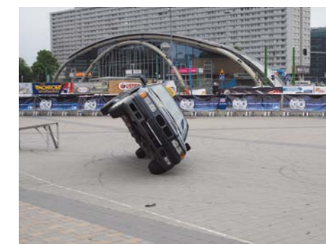
AKROBATICZNE POPISY TOWARZYSZĄCE TYM PROFESJONALNYM TARGOM PRZYPOMINAŁY OBSERWATOROM, ŻE SAMOCHÓD MOŻE SŁUżyć NIE TYLKO DO SERWISOWANIA