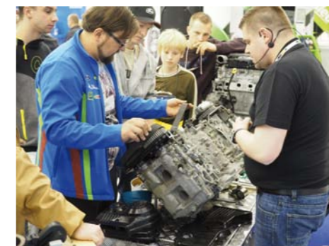
BRANŻOWE SPOTKANIA SĄ NAJLEPSZĄ OKAZJĄ DO WYJAŚNIANIA SPECJALISTYCZNYCH PROBLEMÓW TECHNICZNYCH I BIZNESOWYCH NA KONKRETNICH PRZYKŁADACH