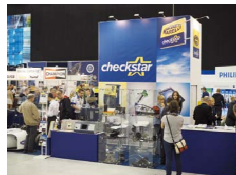
OGÓLNY NASTRÓJ WYSTAWOWEJ HALI PRZYPOMINAŁ PRESTIŻOWE IMPREZY ZAGRANICZNE, LECZ WIĘKSZOŚĆ EKSPONATÓW MIAŁA CHARAKTER PREZENTACYJNO-SZKOLENIOWY

Klasycznym punktem zwiedzania – jak zawsze przy targach motoryzacyjnych