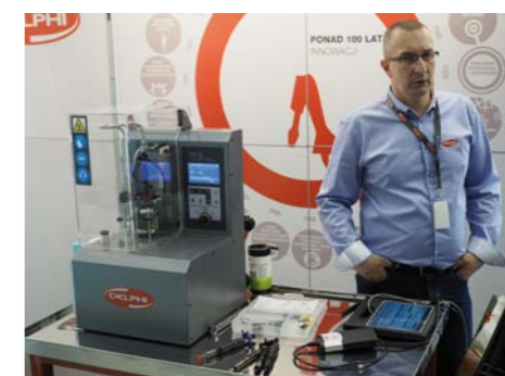
POLSKA PREMIERA TEGO URZĄDZENIA SPOTKAŁA SIĘ Z DUŻYM ZAINTERESOWANIEM FACHOWEJ PUBLICZNOŚCI; POŚWIĘCIMY MU WKRÓTCE ODREBNĄ PUBLIKACJĘ