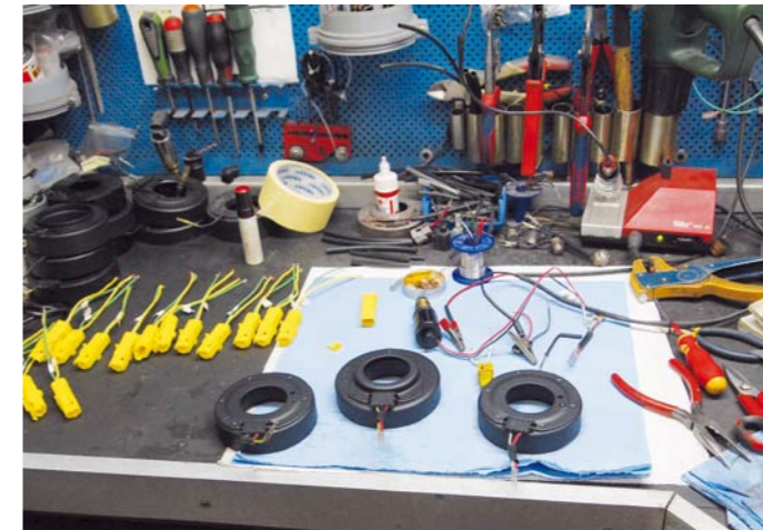
STANOWISKO REGENERACJI ELEKTROMAGNESÓW