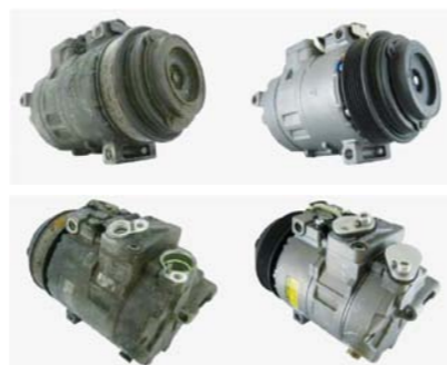
PORÓWNANIE SPRĘŻAREK KLIMATYZACYJNYCH PRZED I PO REGENERACJI

Stanowią one istotną gałąź rynku podzespołów i części regenerowanych, a rozwój tego segmentu cechuje się wysoką dynamiką wzrostu. Coraz więcej firm