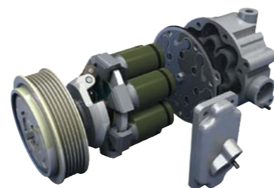
WIDOK WEWNĘTRZNYCH MECHANIZMÓW SPRĘŻARKI

W ramach właściwych czynności kontrolnych należy nastawić klimatyzację na maksymalne chłodzenie, ustawić obroty silnika na 2000-2500 obr./min,