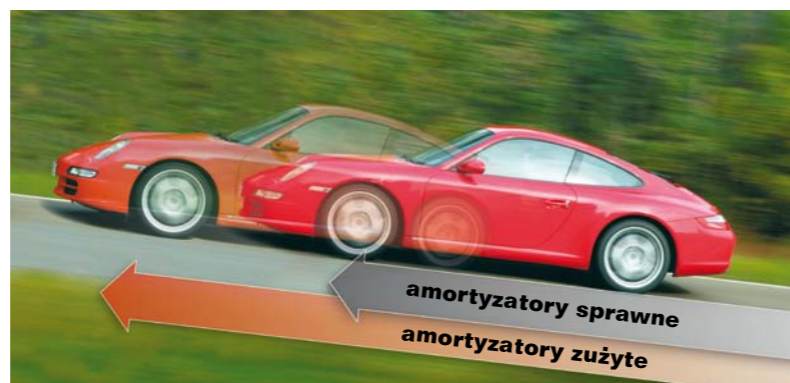
DEŁUGOŚĆ DROGI HAMOWANIA ZALEŻY NIE TYLKO OD HAMULCÓW

w pracy amortyzatorów, lecz zgłaszać je niezwłocznie w „swoim” warsztacie dla wyjaśnienia i rozwiązania problemu. Nie-