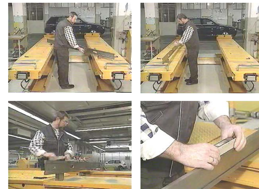
KOLEJNE FAZY POZIOMOWANIA

Technologię można jeszcze bardziej znieczulić na błędy wypoziomowania, stosując inklinometry. To pozwala na uzyskanie mobilności urządzeń do pomiaru geometrii ustawienia kół i ich przemienną pracę na kilku stanowiskach w serwisie. Mimo takiej „niewrażliwości” na brak wypoziomowania należy stosować zasadę poziomowania stanowisk przy pełnym pomia-