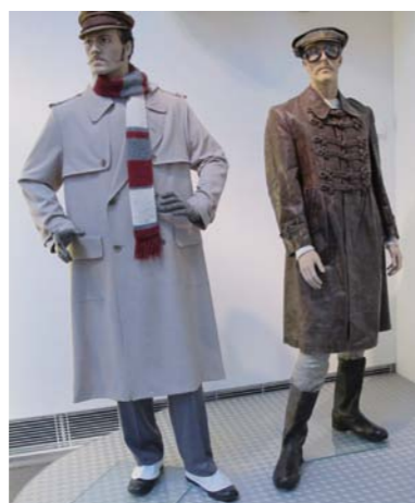
▲ August Horch urodził się w 1868 roku. Pochodził z małomiasteczkowej rodziny rzemieślniczej (kowsko-winiarskiej).

JEDNĄ Z TURYSTYCZNYCH ATRAKCJI MIASTA ZWICKAU, POŁOŻONEGO W ZACHODNIEJ SAKSONII, JEST MUZEUM MIESZCZĄCE SIĘ W DAWNEJ FABRYCE AUGUSTA HORCHA, Z KTÓREJ WYWODZĄ SIĘ CO NAJMNIEJ TRZY ZNANE SAMOCHODOWE MARKI: HORCH, AUDI I... TRABANT. ROZWÓJ TECHNIKI MOTORYZACYJNEJ W NIEMAL CAŁYM XX STULECIU ILUSTRUJĄ TU ZNAKOMICIE ZACHOWANE LUB ODRESTAUROWANE EKSPONATY, STANOWIĄCE RZECZYWISTY DOROBK JEDNEGO PRODUKCYJNEGO ZAKŁADU