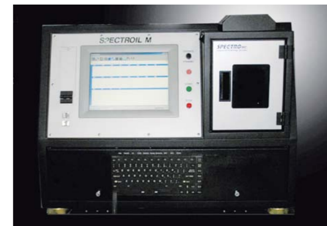
SPEKTROMETR ISKROWY DO ANALIZY ZANIECZYSZCZEN OLEJU