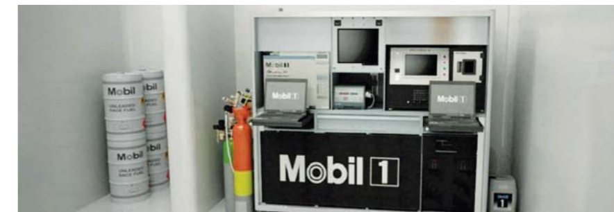
MAC MOBIL 1 ANALYTICAL CENTRE. CZYLI MOBILNE LABORATORIUM ANALITYCZNE UŻYWANE W BOKSACH SERWISOWYCH FORMUŁY 1

Część ich wyposażenia stanowią spektrometry iskrowe, umożliwiające wykrywanie, identyfikację i pomiar stężenia cząstek metali w olejach smarowych i płynach roboczych. Sprawdzany jest w ten sposób aktualny stan elementów silników, skrzyń biegów i układów hydraulicznych, a dokładniej: stopień ciernego zużycia ich wzajemnie współpracujących powierzchni. Rezultaty tych badań są gromadzone w bazach danych i wykorzystywane do późniejszych analiz dokonywanych zarówno przez konstruktorów samochodów wyścigowych, jak i przez personel inżynierski odpowiedzialny za rozwój produktów marki Mobil 1.