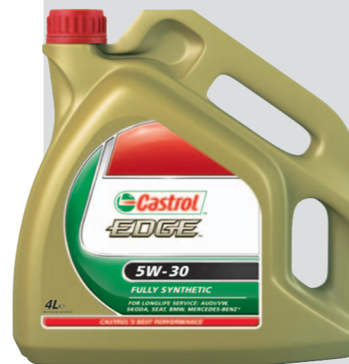
TABELA DOBORU OLEJU