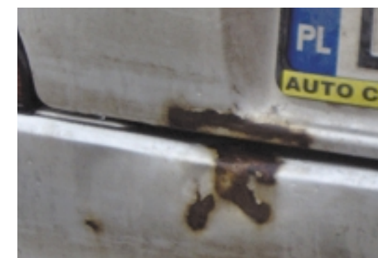
... szybko zamienia się poważniejsze, ale wciąż dające się usunąć w systemie „Fast Repair”

W zakresie systemu wchodzi szybkie naprawy: