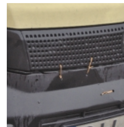
Można i tak, lecz chyba lepiej profesjonalnie skleić