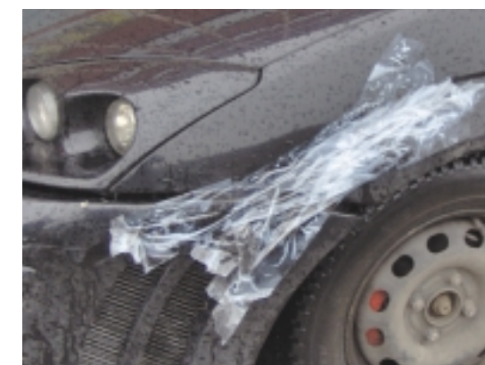
Drobne uszkodzenie powłoki lakierniczej pod taką osłoną...