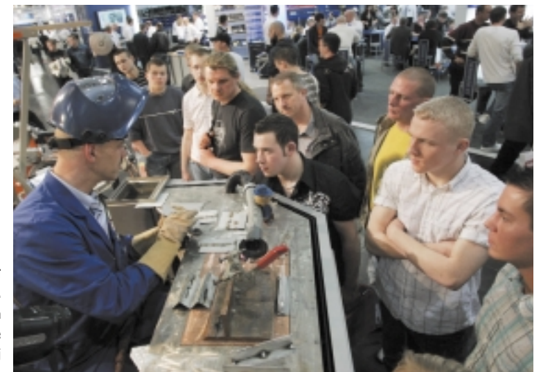
AMITEC 2008 był imprezą udaną. Tegoroczna edycja zapowiada się jeszcze lepiej

realne szanse pozyskania nowych klientów, szczególnie w sferze międzynarodowych kontaktów w Europie Środkowej i Wschodniej. W zeszłym roku targi AMITEC gościły 271 wystawców, w tym 11 firm z Polski. Liczba odwiedzających wyniosła 51 800 przedstawicieli branży. W tym roku ich organizatorzy zwiększyli powierzchnie wystawiennicze o 700 metrów kwadratowych, aby zaprezentować nasze dwa nowe obszary tematyczne: naprawy pojazdów transportowych oraz lakiery samochodowe.